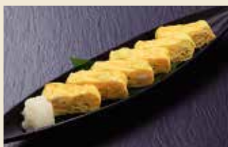
だし巻き玉子 480円 (税抜)