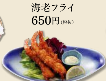
海老フライ 650円 (税抜)