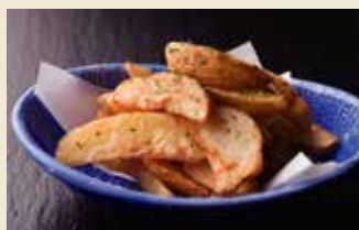
ポテトフライ 380円 (税抜)