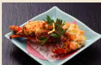
ロブスターグラタン [ハーフ] 3,500円 (税抜)