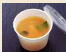
味噌汁 150円 (税抜)