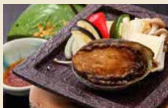
活あわびのおどり焼き 1,800円 (税抜)