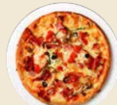
ミックスピザ [20cm] 980円 (税抜)