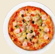
シーフードピザ [20cm] 1,280円 (税抜)