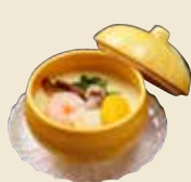
茶碗蒸し 500円 (税抜)