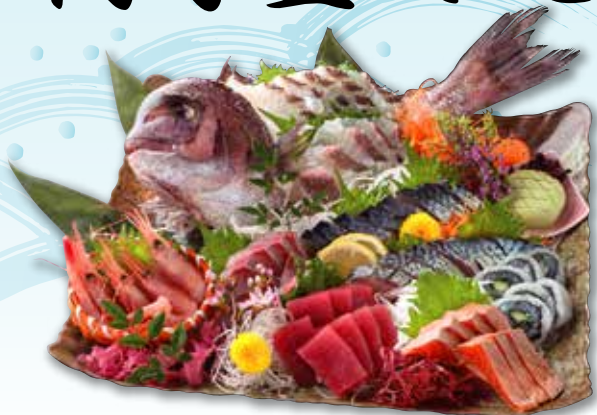
みかん鯛&ハーブ鯖 刺身盛合せ