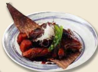
鮮魚のあら炊き 680円 (税抜)