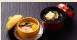
茶碗蒸し+お吸いものセット 200円おトク! 600円 (税抜)