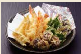
天ぷら盛合せ [5人前] 5,800円 (税抜)