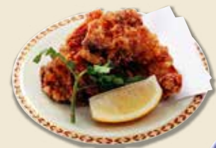
若鶏ザンギ 580円 (税抜)