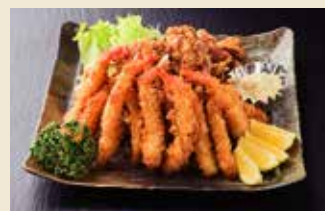
海老フライとザンギの盛合せ [5人前] 3,800円 (税抜)